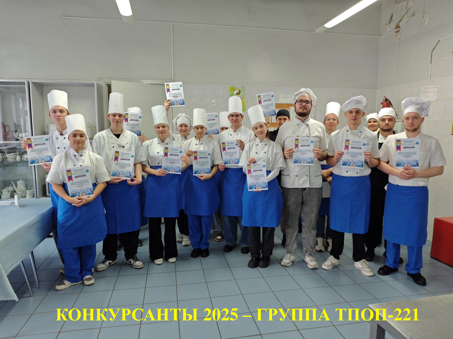
КОНКУРСАНТЫ 2025 – ГРУППА ТПОП-221